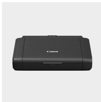
Canon MAXIFY BX110 mit Akku